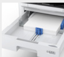
Bac papier de 500 feuilles