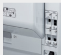
Options de port Ethernet/Fax